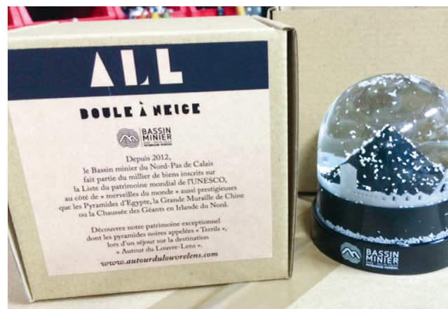
Une belle idée de cadeau de Noël.