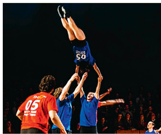
2 équipes seront opposées puis départagées par le public.