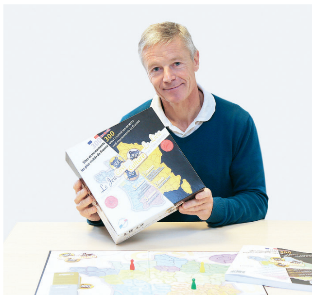
Il a fallu 3 ans pour concevoir Casino Culture.

Testé auprès des collégiens, recommandé par les associations de professeurs d'histoire et de géographie, le jeu a des principes simplissimes. Atteindre le premier 3 000 points pour un adulte, 500 pour un enfant, en répondant à des questions sur les principaux monuments français. « Lorsque l'on remporte correctement à 2 questions sur 3, on marque les points. Dans le cas inverse, le joueur (ou l'équipe) adverse reprend la main et peut scorer. Tout le monde reste attentif. De plus, la prise en main est